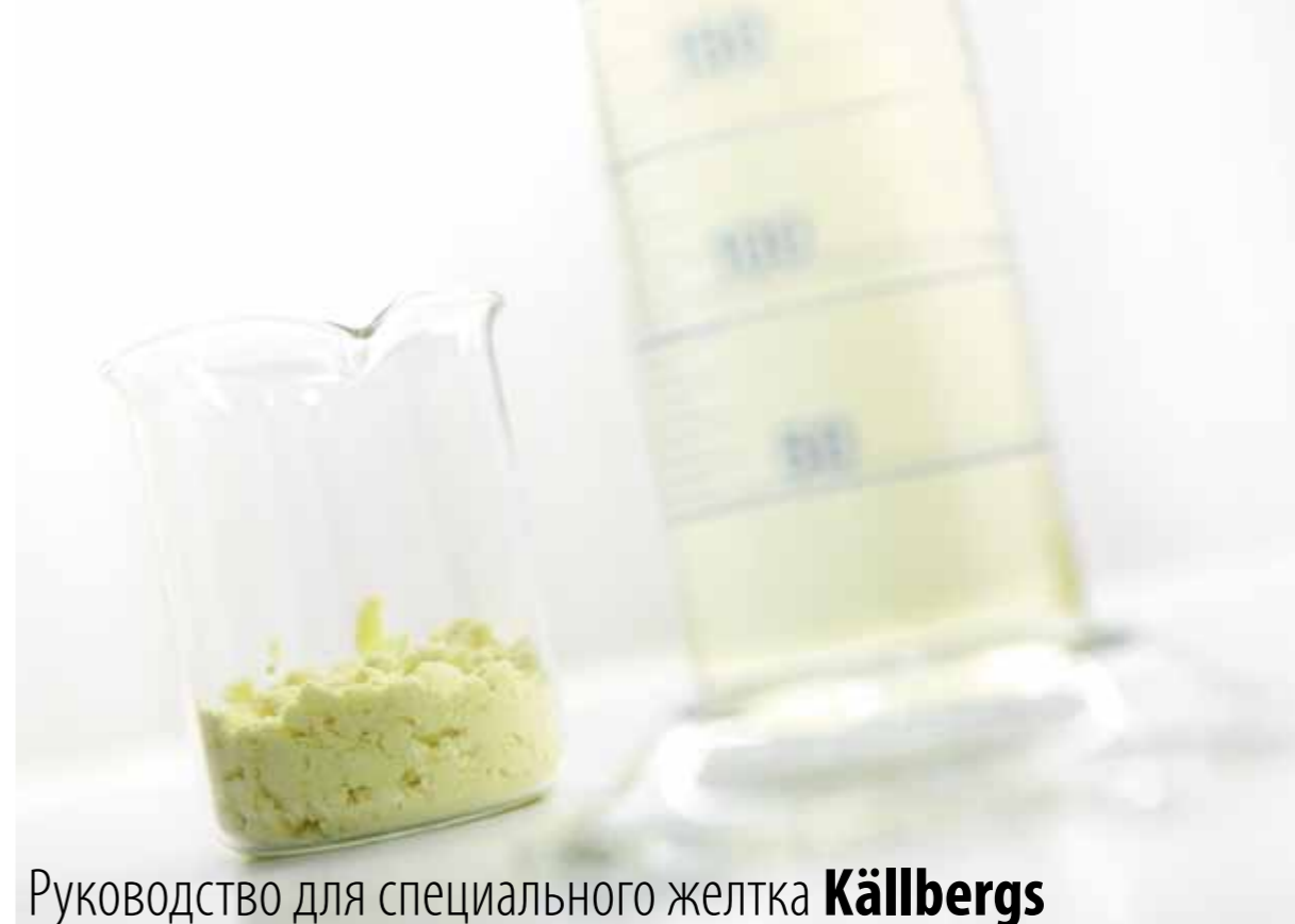
Руководство для специального желтка Källbergs

Уникальная компетенция нашего персонала в области ингредиентов яйца и свойств его эмульсии, а также знания о других исходных материалах, например, крахмала и гидроколлоидов. Комбинируя эти ингредиенты в необходимых пропорциях, мы можем вместе с заказчиком обеспечить рентабельное и стабильное производство конечных продуктов.